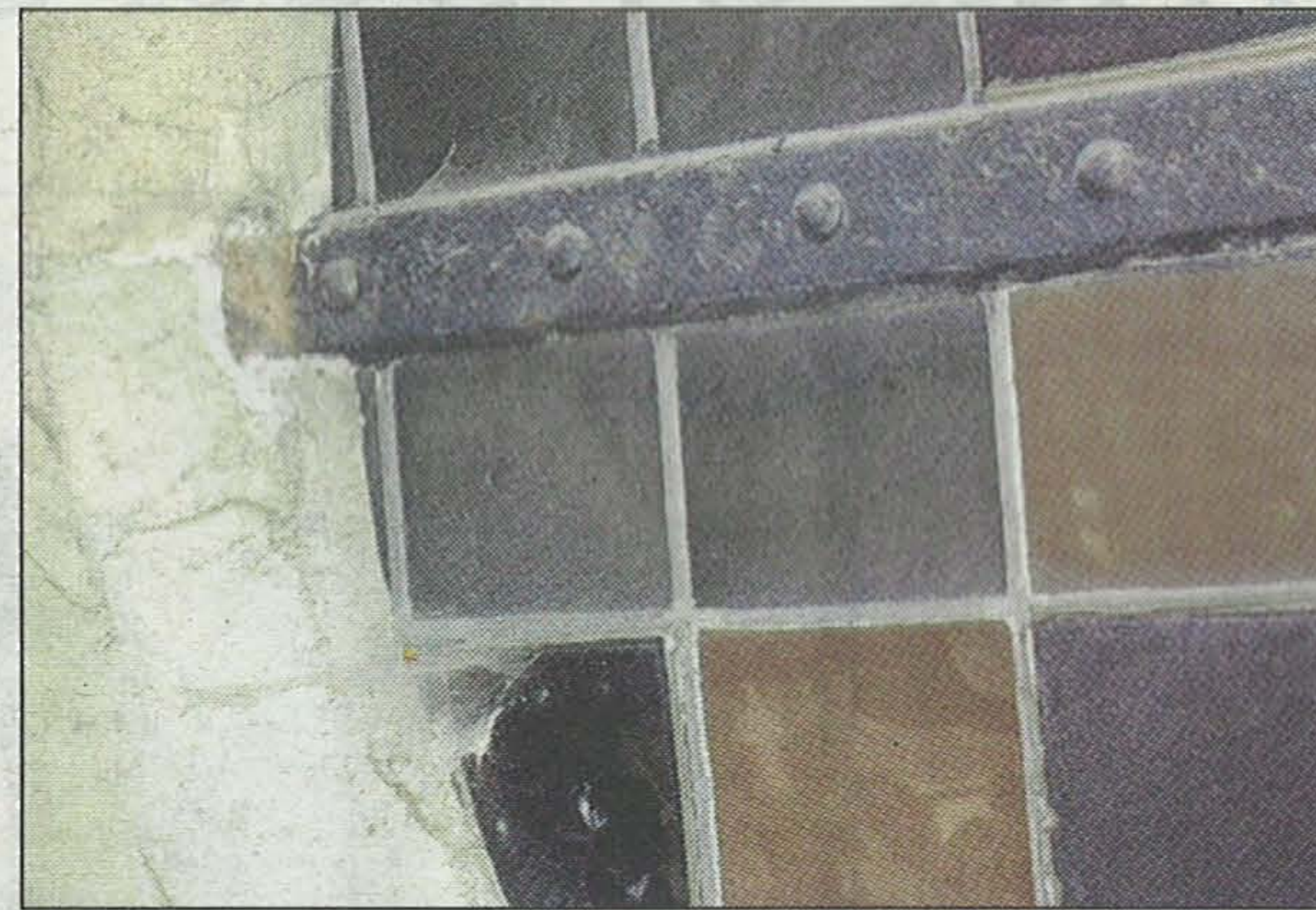
De glas-in-loodramen verkeren in slechte staat en moeten hersteld worden.