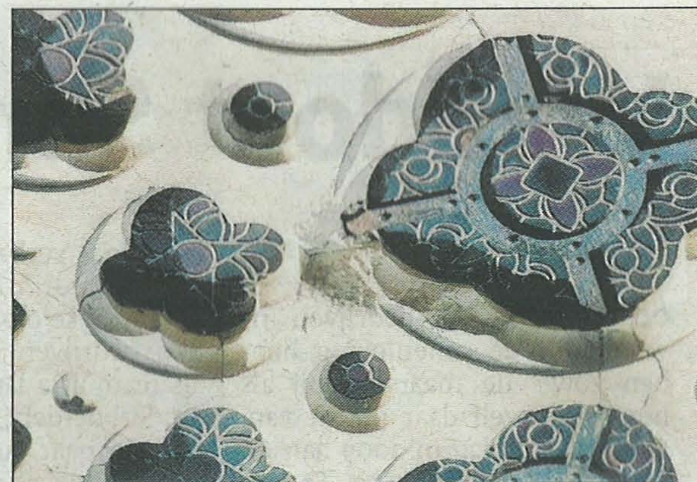
De natuursteen in ramen brokkelt af door het uitzetten van het metaal.