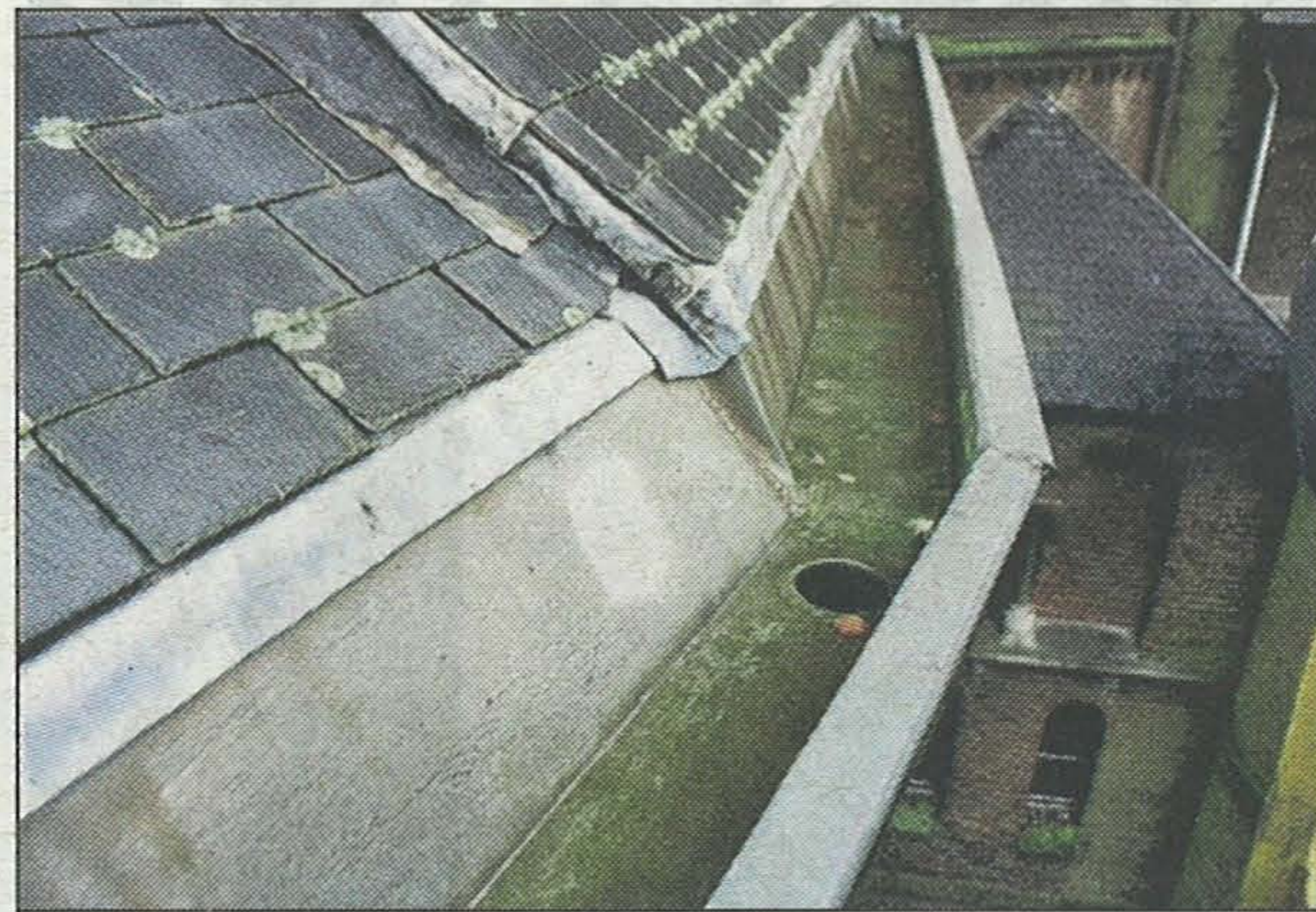
De goten van de Sint Bavokerk moeten dringend vervangen worden.