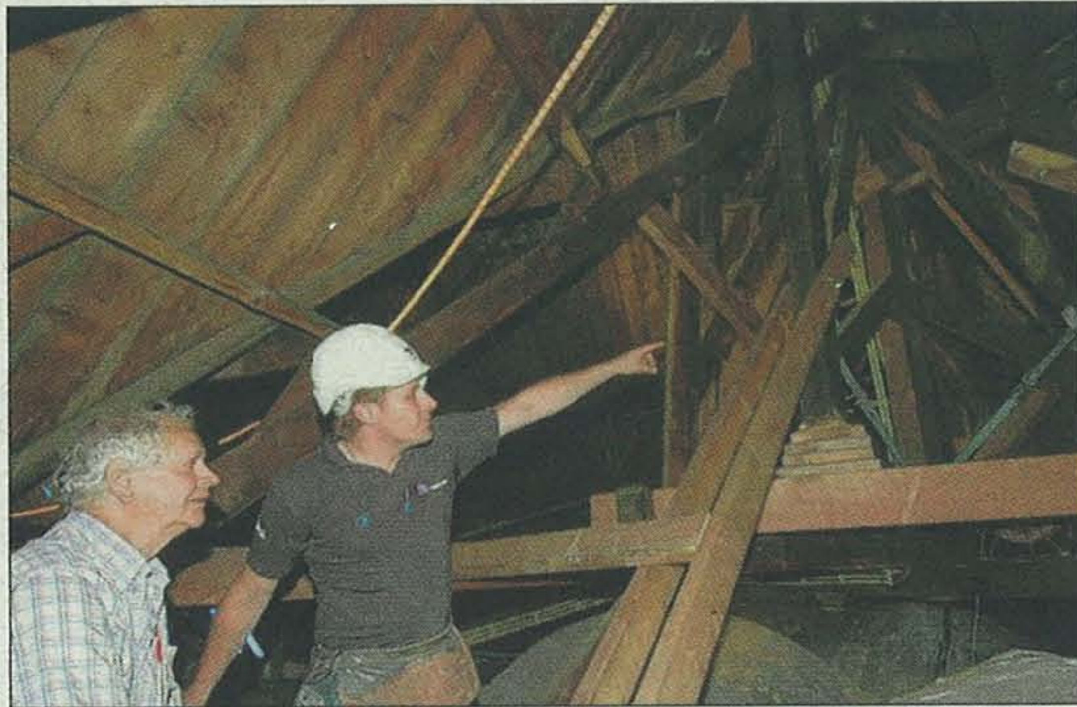
Bouwlieden overleggen over het binnenwerk van het kleine torentje van de Gummaruskerk, dat extra gestut moet worden. De bollen rechtsonderin zijn de gemetselde koepels van de kerk.

Een duidelijker bewijs dat de 3,3 miljoen euro kostende restauratie aan de ruim 100-jarige neogotische Wagenbergse kerk is begonnen is er niet. Steigerbouwers zijn met behulp