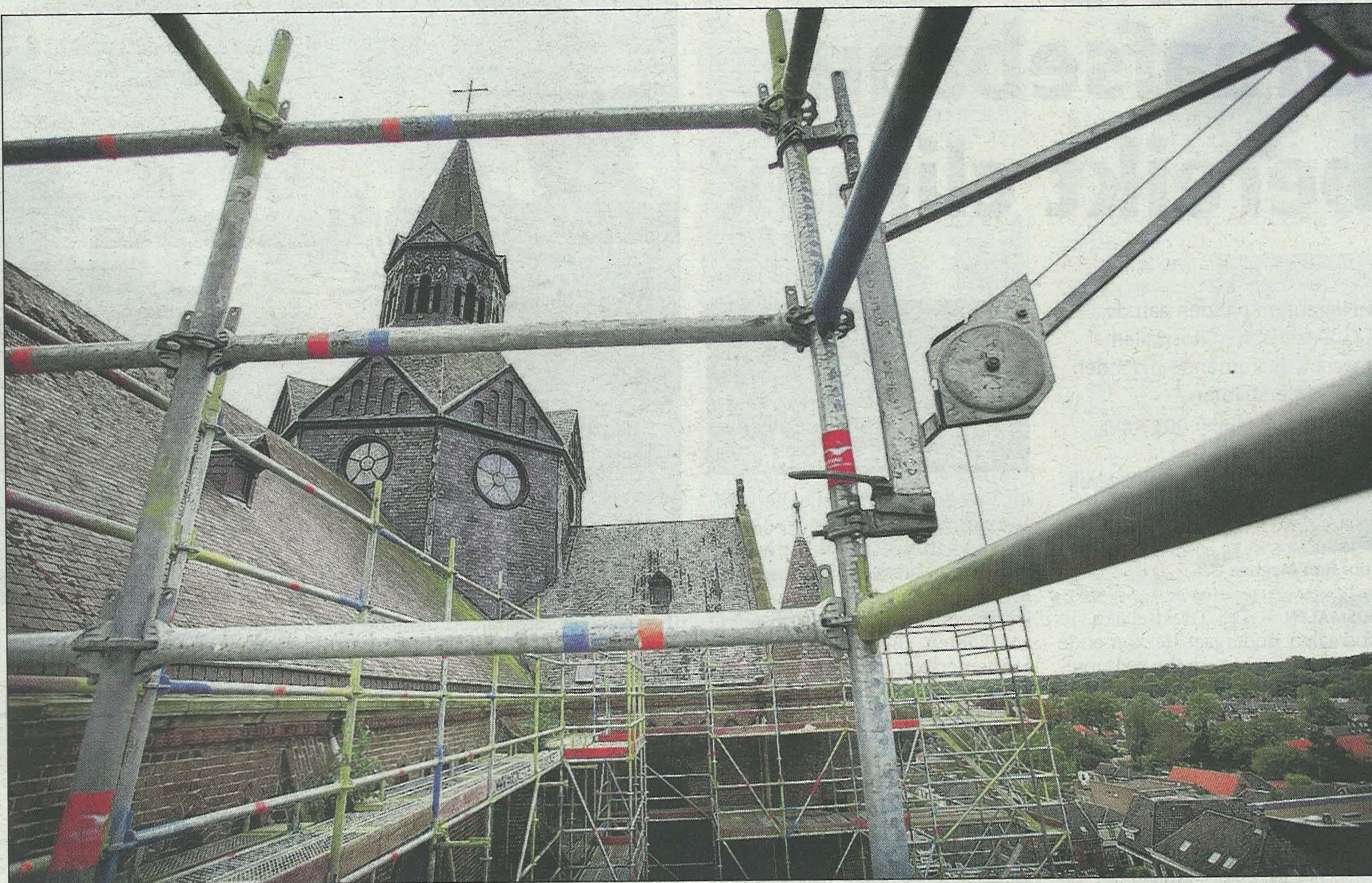
Een nieuwe blik op de Petruskerk in Vught, mét steigers. De restauratie begint aan de buitenkant.

Hij introduceerde meteen twee nieuwe begrippen: de Petrusvaarder en Petrusganger. Eretitels die betrokken Vughtenaren kunnen verkrijgen als zij de Petrus finan-